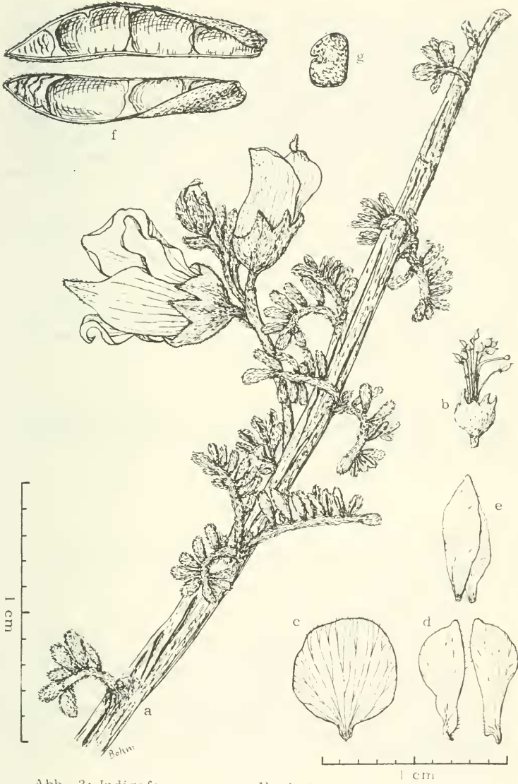
Abb. 3: Indigofera merxmuelleri